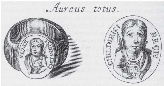
Abb. 2: Zeichnung des Siegelringes Childerichs I., der in seinem Grab in Tournai gefunden wurde.

verweist als kaiserliches Ehrenzeichen auf seine Funktion in der römischen Armee. Childerich war fränkischer König und römischer Offizier; in beiden Funktionen war sein Führungsanspruch wesentlich von seiner Rolle im Krieg bestimmt. In seinem Grab fanden sich Pferde und Waffen, nämlich Axt, Lanze und Schwerter. Sein Grab steht stellvertretend für die Quellen, denen wir große Teile unserer Kenntnisse über die Kriege der Merowingerzeit verdanken. Grabbeigaben, die sich in Lateineuropa bis zum frühen 8. Jahrhundert finden, geben Auskunft zu Aussehen und Beschaffenheit frühmittelalterlicher Waffen. Diese Funde sind nicht immer leicht zu interpretieren, so dass oftmals ungeklärt bleibt, welche soziale Kategorie symbolisiert werden sollte. Diente die Beigabe von Waffen dazu, das Alter, das Geschlecht oder die soziale Stellung sichtbar zu machen? In welcher Beziehung standen Zier- zu Kriegswaffen, nicht nur mit Bezug auf eine bestattete Person, sondern für die Masse der Krieger? Und schließlich wird aus Grabfunden nicht deutlich, wie die Waffen im Krieg eingesetzt wurden.